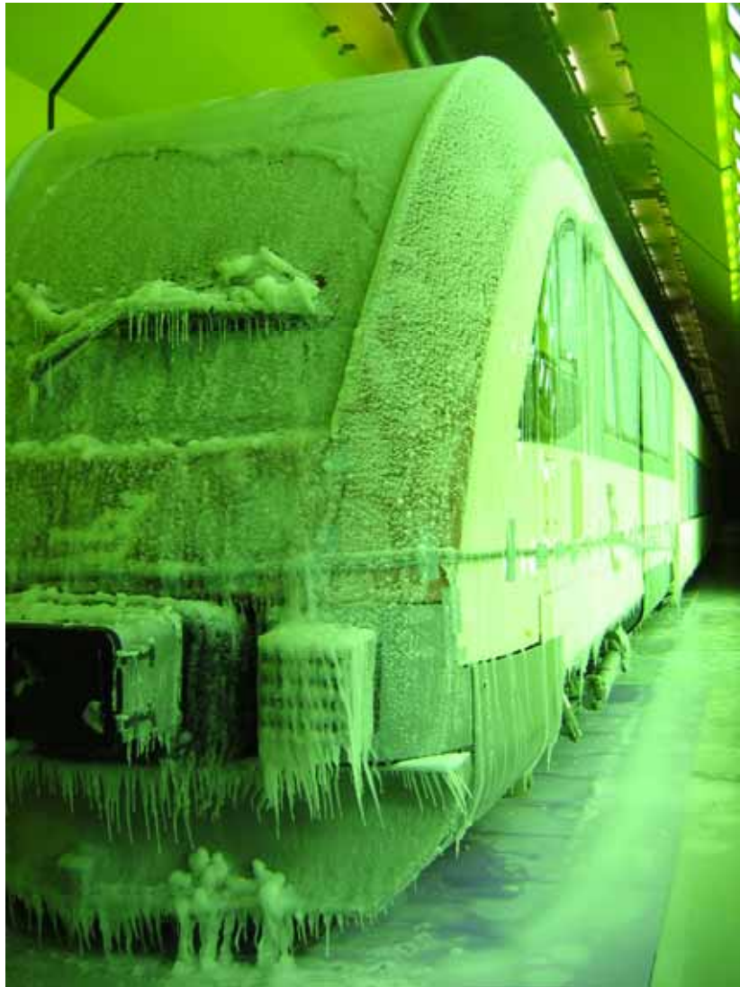
Abb. 1 Schienenfahrzeug unter extremen Klimabedingungen im Klimawindkanal

300 km/h um das Fahrzeug heult und auf Knopfdruck jedes Wetter „zusammengebraut“ wird, zeigt im Wageninneren die Klimaanlage, was sie kann. Die Techniker der Betreibergesellschaft kontrollieren die Leistung der Heizungs-, Lüftungs- und Klimaanlage genauso wie das reibungslose Funktionieren wichtiger Teile des Zuges wie Türen, Bremsen und Scheibenwischer.